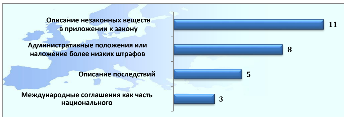
Схема 3: Наиболее часто упоминаемые решения

Из ответов можно взять пять вариантов законодательных решений в отношении НПВ: 1) неурегулированность, 2) административное правонарушение/ проступок, 3) наличие перечня веществ или категорий, прилагаемых к закону, 4) регулирование по закону и, наконец, 5) описание последствий, а не химической структуры вещества. Эти пять решений не были взаимоисключающими в обязательном порядке.