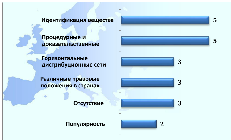
Схема 2: Наиболее часто упоминаемые проблемы